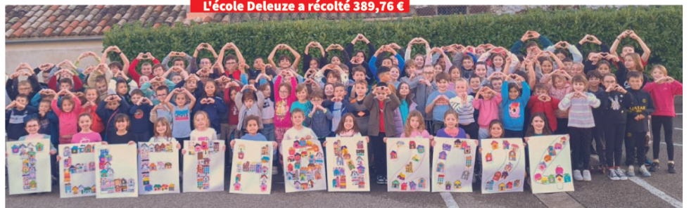
L'école Deleuze a récolté 389,76 €