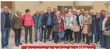
Concours de belote du téléthon

Le Téléthon est organisé par le comité des fêtes et la municipalité. Le marché de Noël avec ses exposants, les activités proposées par les associations et des donateurs individuels ont permis de récolter 2 700€. Bravo à tous pour votre engagement et merci aux nombreux donateurs.