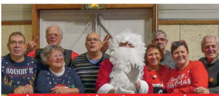
L'équipe du comité des fêtes au marché de Noël