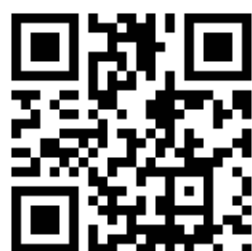
QR-code du site www.shb-rando.fr

Le site www.shb-rando.fr est déjà en ligne, et l'inauguration officielle des sentiers et parcours sportifs est prévue pour janvier 2026.