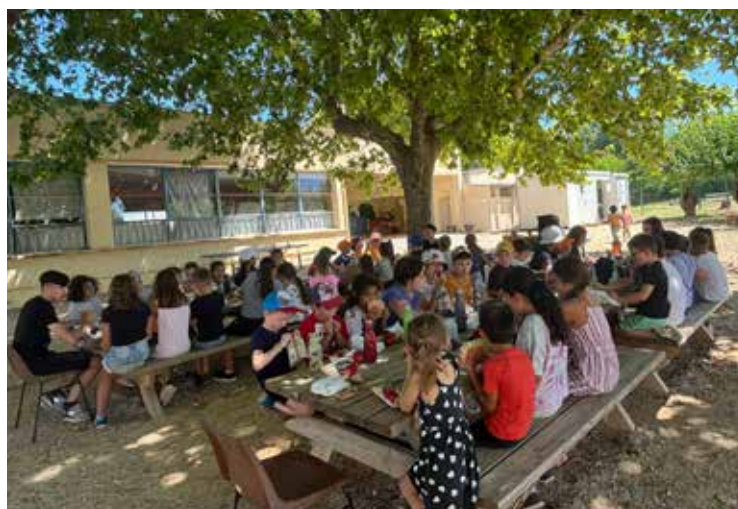
Repas en extérieur aux Cocci'Malins