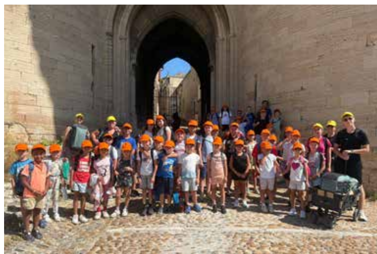
Visite du Fort Saint André à Villeneuve les Avignon à l'occasion des journées du patrimoine