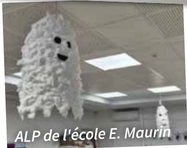
ALP de l'école E. Maurin