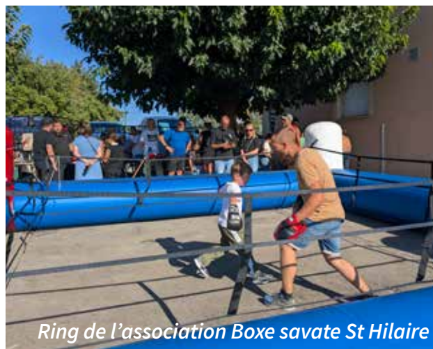
Ring de l'association Boxe savate St Hilaire