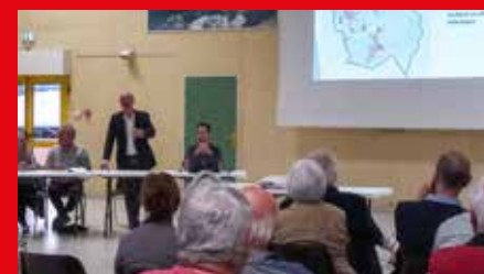
Réunion publique de présentation du PADD

La commune poursuit la construction de son Plan Local d'Urbanisme (PLU), document essentiel qui fixe les orientations d'aménagement et de développement du territoire.