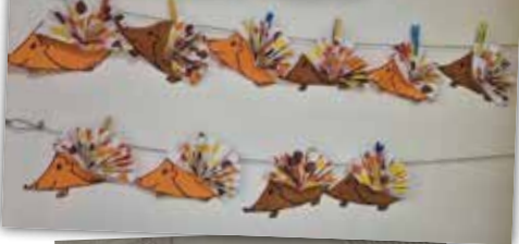
ALP de l'école E. Maurin

Par ailleurs, l'ALP maternelle est désormais installé à l'école, permettant une meilleure optimisation de l'organisation.