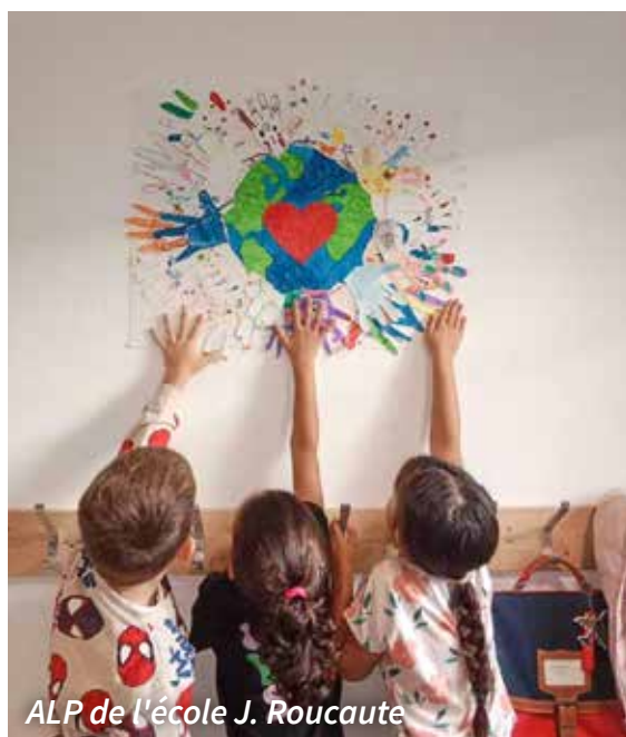
ALP de l'école J. Roucaute

Ces interventions traduisent la volonté communale d'investir durablement dans la qualité, la sécurité et le bien-être au sein des écoles.