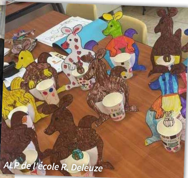
ALP de l'école R. Deleuze