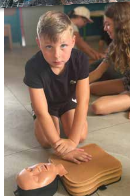
Initiation aux gestes de premiers secours avec l'association prévention action sport et secourisme.