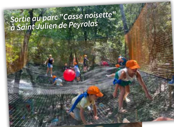
Sortie au parc "Casse noisette" à Saint Julien de Peyrolas

Des initiations aux sports inclusifs ont également permis de promouvoir le respect des différences et la coopération au sein du groupe.