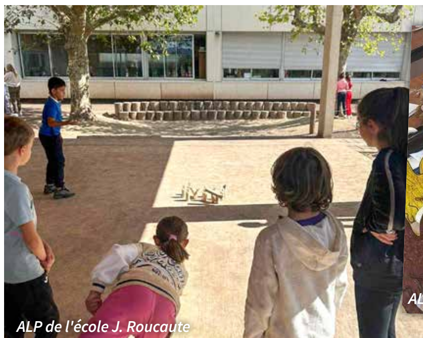
ALP de l'école J. Roucaute